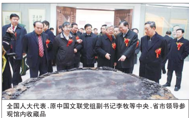
全国人大代表、原中国文联党组书记李牧等中央、省市领导参观馆内收藏品

引人注目的是,“耕夫草堂”的东西两院为设计新颖,曲径通幽,错落有致的碑廊。在亭台廊榭的装点映衬下,192块精雕细刻的碑