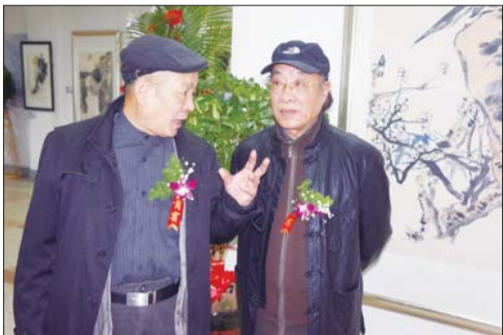
▲山东省文联副主席、山东省美协主席、山东艺术学院院长张志民与尹延新交流