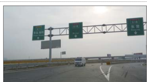
在通往威海的指示牌上,威海两个大字被遮住。