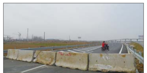
25日上午,轸格庄立交桥去威海的道路被封死,市民骑摩托车调头。