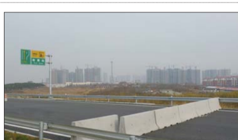
由烟台去威海方向的道路被堵死。

工作人员称,立交桥的路线设置参考了烟台市交通局的意见,当初的愿景非常好,将烟台的交通网络连接起来,去威海、海阳、济南等都是相通的,但是这项工程确实复杂