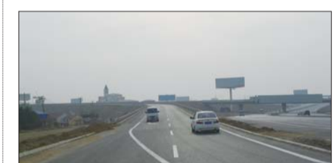
25日上午9点多,在轸格庄立交桥上,一辆车逆行而上。