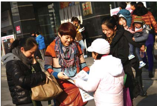
小报童的卖报行动得到了不少市民的支持。