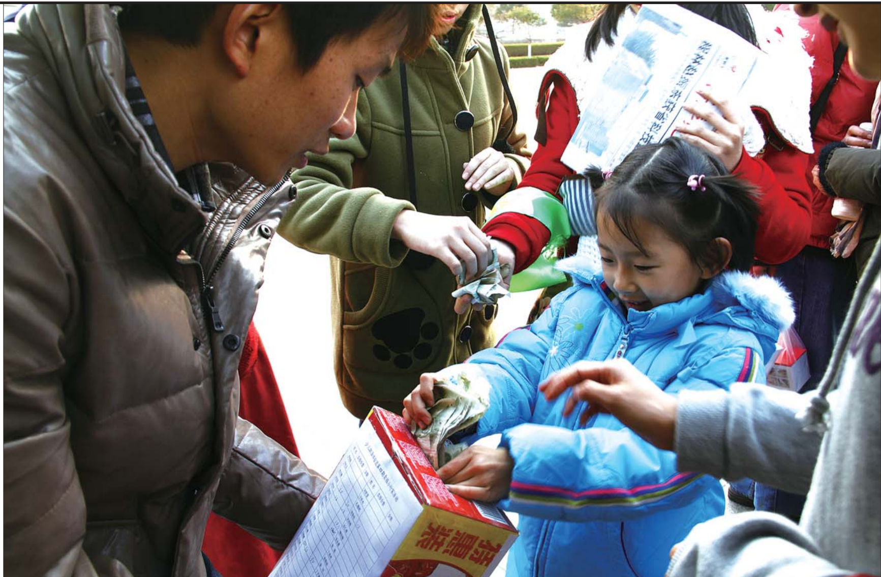
小报童将所得收入全部捐献,为三庄镇竖旗小学的贫困儿童购买棉衣。