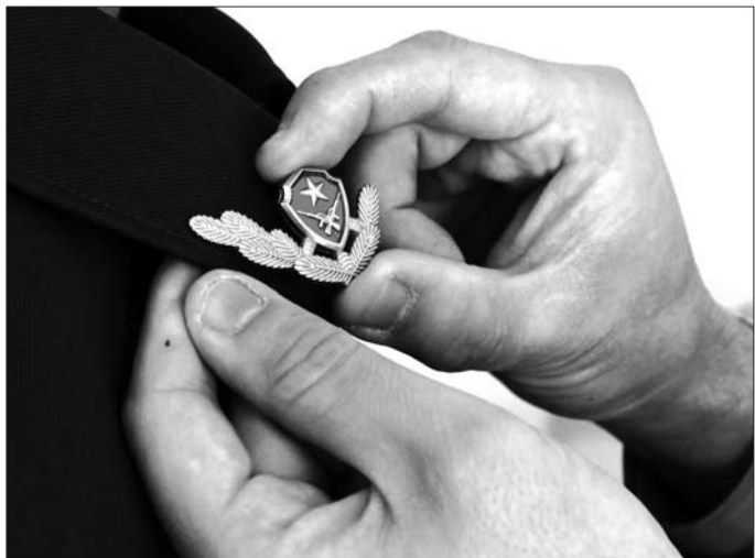
中队长为退伍老兵摘下领花。