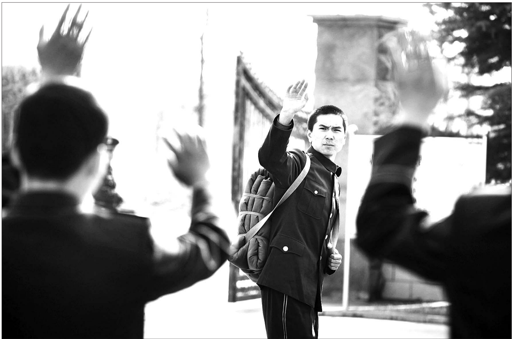
都运声恋恋不舍地和战友挥手告别。