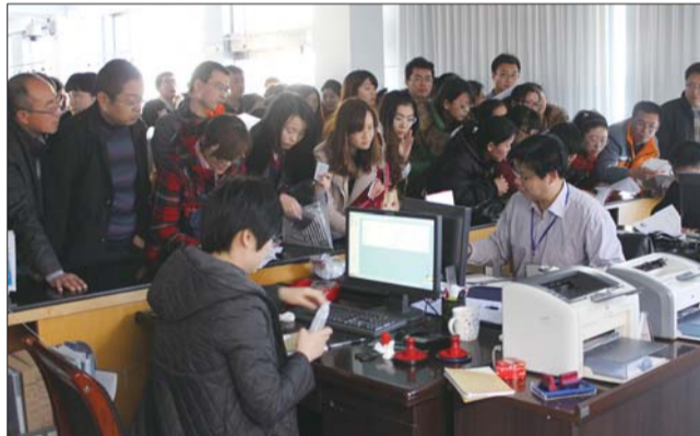
福山事业编报名现场火爆。

景。”考生小赵说,与网上报名相比,由于现场报名的花费较多,她本以为来的人不会太多。