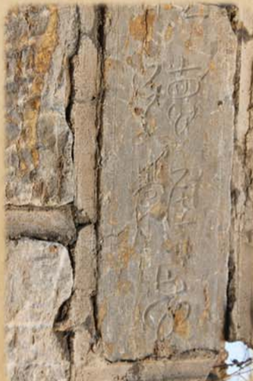
堤坝上有些石碑字体很飘逸。