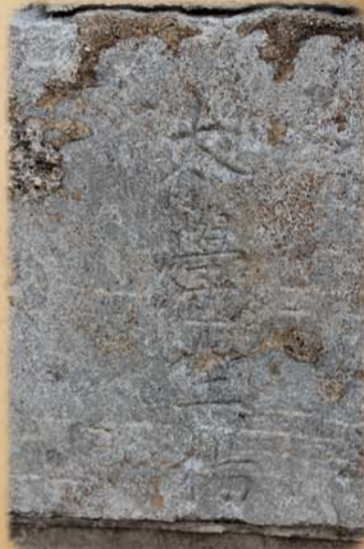
刻有“太学生杨”的字碑。