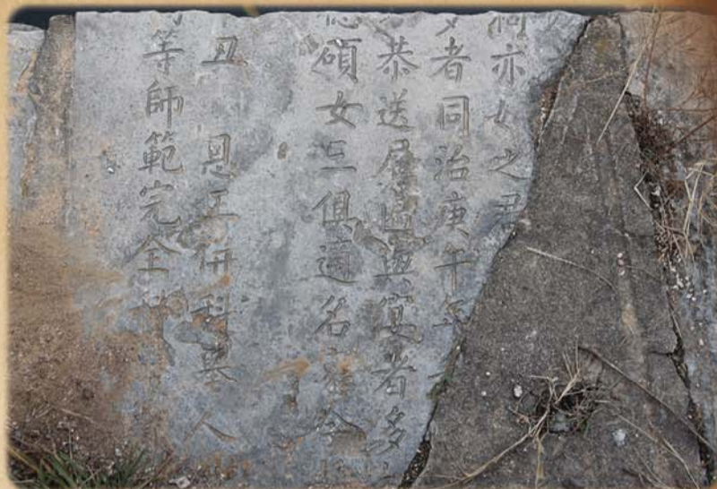
堤坝上刻有“同治庚午年”字样的石碑。