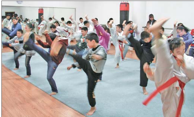
在跆拳道馆，小读者们在学习踢腿动作

威海青少年宫跆拳道体验活动和威海妇女儿童活动中心武术体验活动持续到12月底，有兴趣的同学可免费参加体验。体验时间是每周六、周日(需提前电话报名)。报名电话：5232580,13081496758