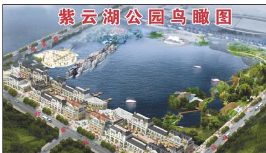
紫云湖公园鸟瞰图