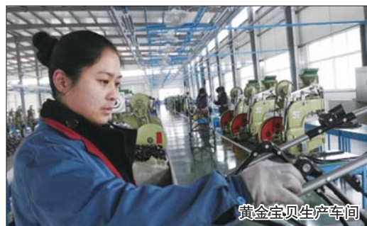
黄金宝贝生产车间