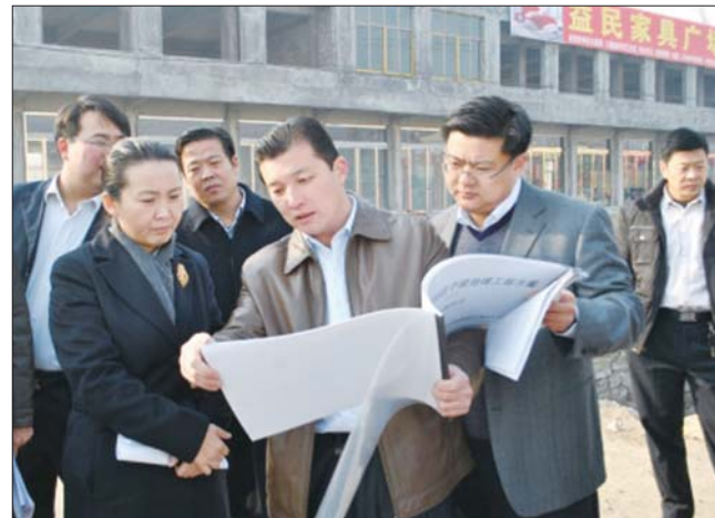
区领导在项目建设现场办公