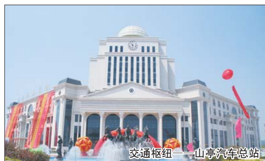
交通枢纽——山亭汽车总站