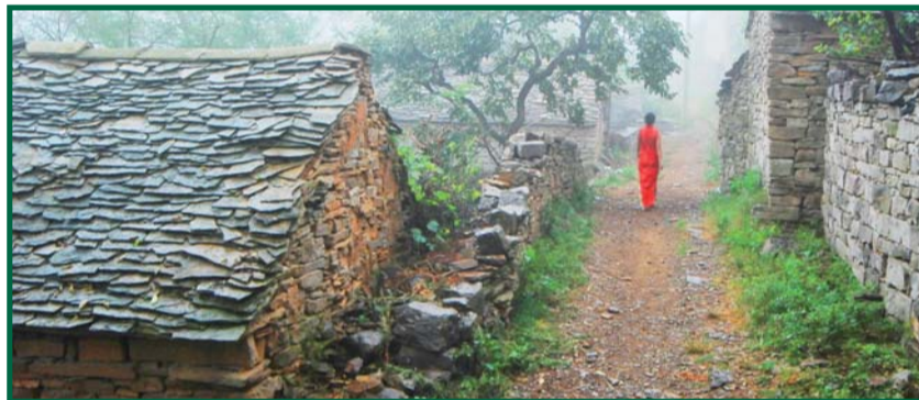
走进翼云石头部落