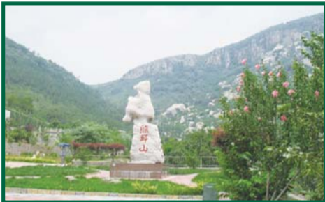
地质奇观 探险胜地——熊耳山双龙大裂谷