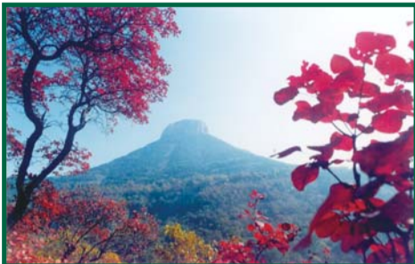
天下第一崮——抱犊崮风光