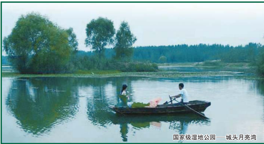
国家级湿地公园——城头月亮湾

D2:早早餐后乘车赴台儿庄区,参观【台儿庄大战纪念馆】、天下第一庄——【台儿庄古城】,中餐后乘车赴【铁道游击队纪念馆】参观游览,游览结束后乘车返回温馨的家。