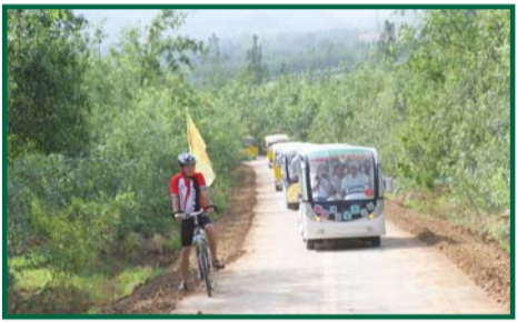
店子万亩枣园绿道