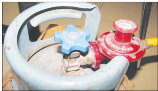
液化气罐开关处没有检验标示。