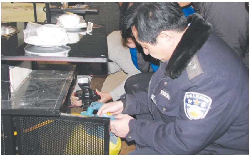
执法人员抽查火锅店的液化气罐。