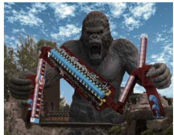
惊险刺激的共工的愤怒项目

共工的愤怒也是超大型娱乐项目,一个高大健硕的黑猩猩手里拿着旋转枪,游客坐在里面在距离地面近10米空中忽高忽低、忽而下降、忽而横斜、忽而倒转。只见行云脚下过,大地扑面而来,天旋地覆,乾坤倒转,好不刺激。