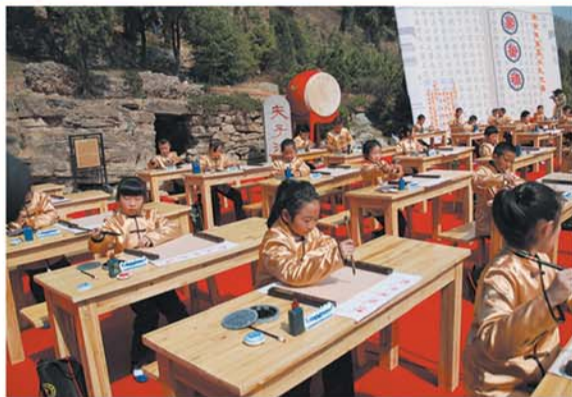
▲尼山春季祭孔之开笔礼

曲阜市三孔旅游服务公司成立于1984年,具有独立法人资格,是一家集文化展览、景区管理、旅游服务、餐饮住宿、祭祀演艺及旅游商品研发制作与销售为一体的综合性国有文化旅游企业,下设:孔府老龄实业公司、三孔保洁服务有限公司、孔府工艺品作坊有限公司、曲阜中国国际旅行社、曲阜三孔旅游旅行社、曲阜市机关招待所、济宁市文物店、古典乐舞祭祀演艺中心、尼山景区管理中心、孔林电瓶车游览观光中心以及设立在“三孔”景区和曲阜游客集散中心的十几处旅游商店。是全省唯一一家拥有文物复原陈列一级资质的企业。近四年来,公司从2006年的负债150万元,营业收入仅53万元,上交税金2万元发展到2011年的营业收入过4000万元,实现利税1000万元,增加社会就业岗位500多人,取得了经济效益和社会效益双丰收,开创了三孔旅游服务公司全面而高速发展的崭新局面,为全市文化产业跨越发展做出了积极的贡献。公司先后荣获“山东省青年文明号”、“山东省旅游服务名牌”、第八届创建《全国诚信单位光荣榜》上榜单位、“2011年度山东省好客导游团队”、“山东省金牌旅游购物商店”、“山东省旅游商品研发基地”等荣誉称号。