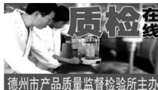
德州市产品质量监督检验所主办

近年来,古贝春集团积极培育产业生态文化,培养爱护自然、循环再生的生态意识和生态行为,引导企业的活动方式和产品功能向产品绿色化、服务人性化、环境友好化转变,树立绿色企业的生态、文化形象,打造了一个和谐优美的生态园区。