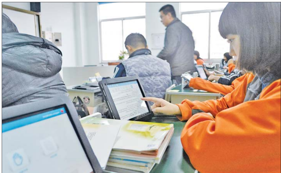
▲使用ipad上课,方便快捷,很受同学们欢迎。

为了推动国际部考试评价体制与国际教育理念相结合,顺应素质教育要求,调动学生们主动学习的积极性和创造性,近来威海一中国际部对月考方式进行了尝试性地调整和改革,在原有单一笔试的基础上,新增了take-home exam(带回家的考试)部分和PPT展示。不仅如此,目前国际部的所有学生全部配备了教学iPad,以增加课堂教学的有效性和趣味性。