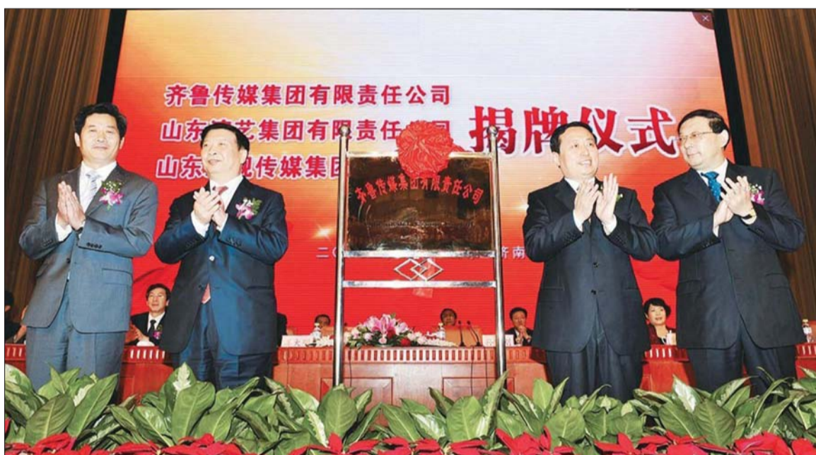
9月20日,齐鲁传媒集团揭牌成立仪式在济南举行。图为省委副书记、省长姜大明(左二),省委常委、宣传部长孙守刚(右二),大众报业集团党委书记、董事长、总编辑,齐鲁传媒集团党委书记、董事长傅绍万(左一),大众报业集团党委副书记,齐鲁传媒集团总经理梁国典(右一)在揭牌仪式上。