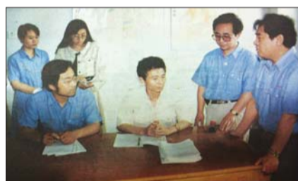
1993年齐鲁晚报第一次公开面向社会招聘的编辑记者与晚报领导签署聘用合同,在全国报业率先实行全员招聘。