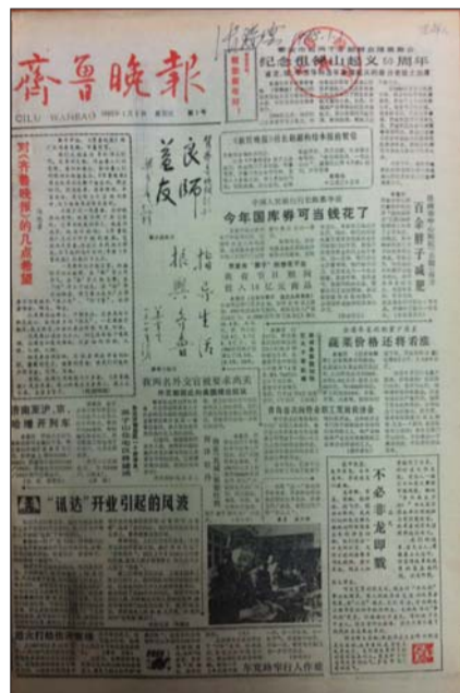
1988年1月1日,山东省第一份都市生活类报纸齐鲁晚报正式创刊。这是齐鲁晚报的创刊号。