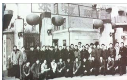
1988年1月1日,齐鲁晚报部分创刊人员在报社门前合影。