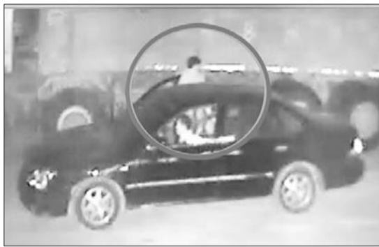
▶“油耗子”驾车靠近货车准备偷油。