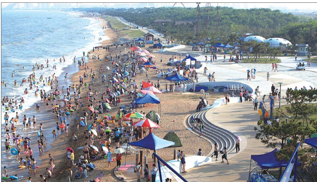
一到夏季,美丽的日照海滩就吸引来不少游客。