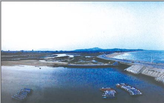
上世纪末,日照海边首次出现了让人耳目一新的游艇。