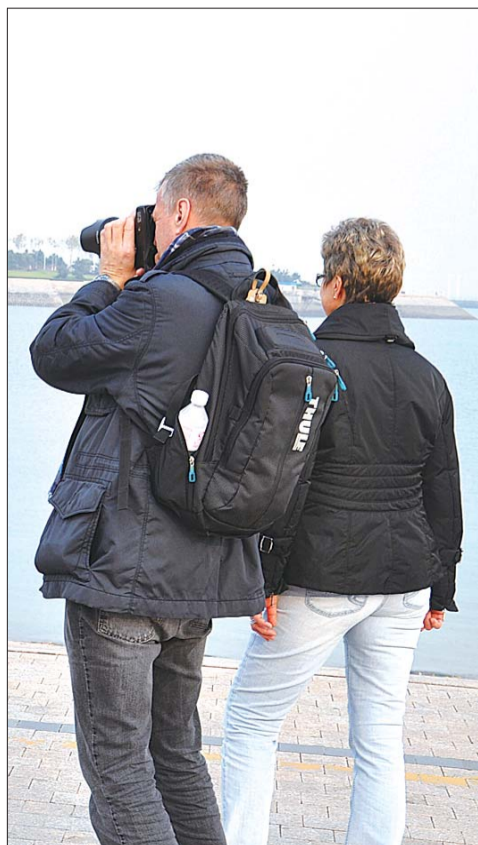
美丽的日照金沙滩还吸引了不少外国游客。

进入上世纪九十年代,着手对海边进行开发的日照,从无人问津到今年一个旅游休闲汇就带来102.2亿元的收入,这座城市用数字给出了“蓝色答案”。