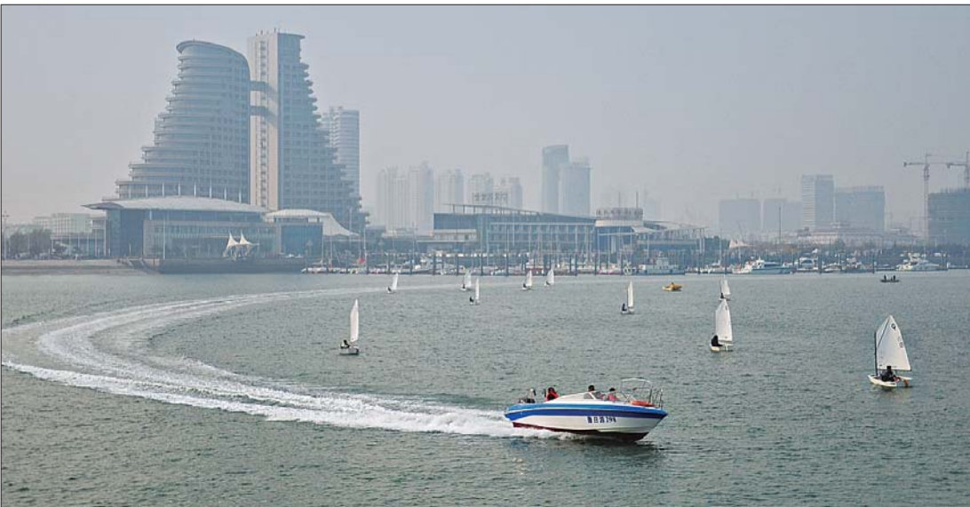
2012年11月7日,日照奥林匹克水上公园世帆赛基地,不少青少年帆船选手在此训练。

日照市1989年建市。23年间,日照从一个鲁南小城发展为滨海文化名城、水上运动之都。