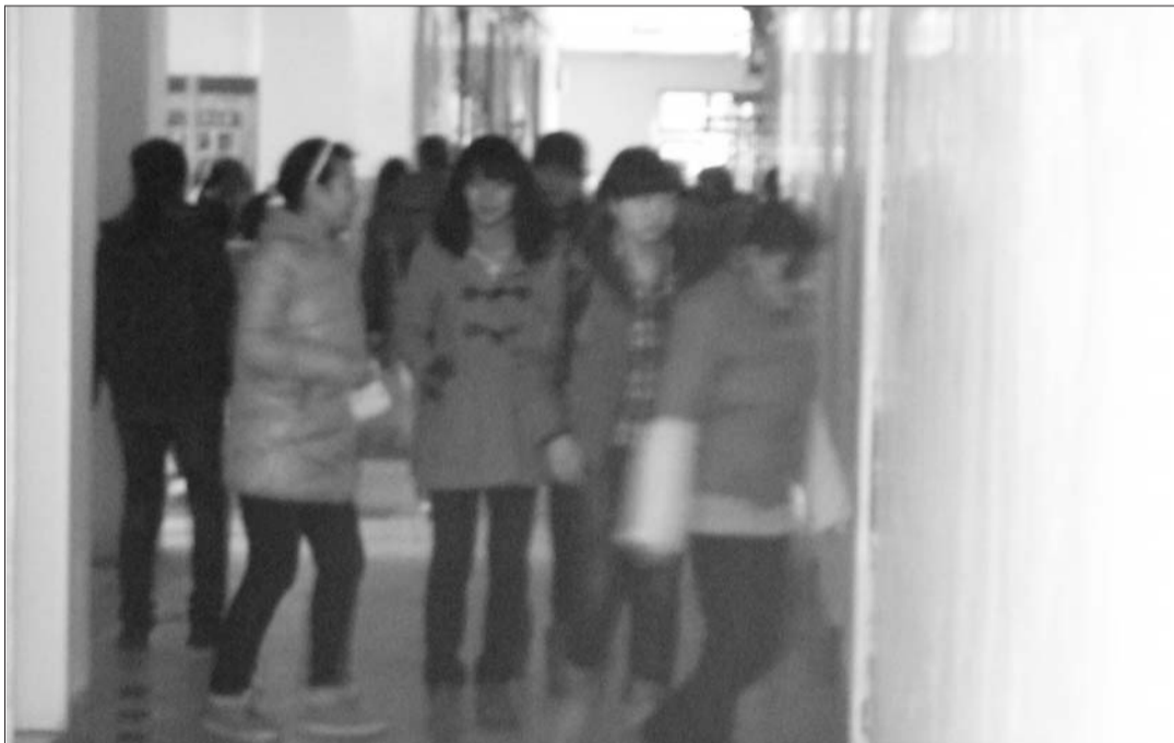
等待上厕所的女生排起了长队。

今年11月19日,全国12所师范院校的女生在“世界公厕日”向校长致信要求扩建学校的女厕所,以解决女生如厕难的问题。29日,记者在枣庄市一所高校中发现,女生如厕难现象同样存在。