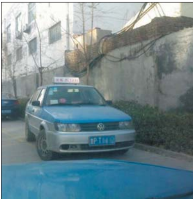
据知情人士透露,没有此号牌的正规出租。