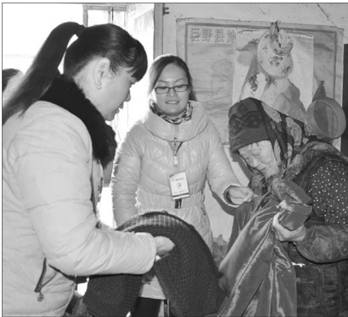
巨野蚂蚁义工们特地将前段时间募捐来的200余件棉衣分发给老人。