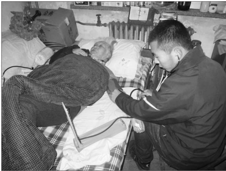
义工为老人检查身体。

看着义工们忙碌的身影,福利院负责人很是感动,“这些老人在这里虽然生活无忧,但平时很孤单,志愿者们能来这里看望老人们,给他们带来欢乐,真的很感谢他们。”