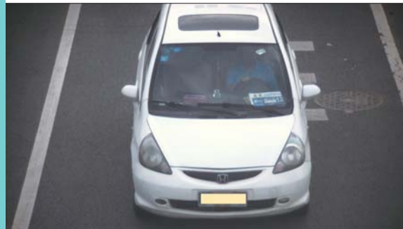
违法行为:违反规定使用专用车道