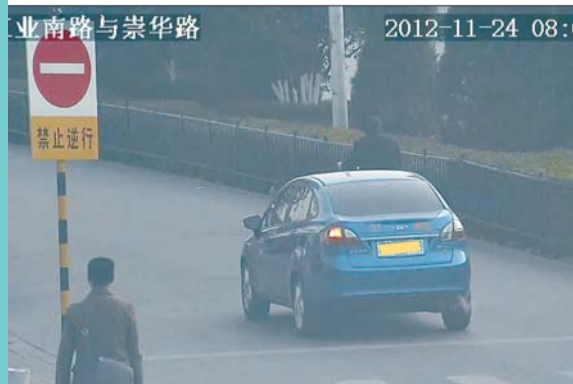
违法行为:机动车逆向行驶