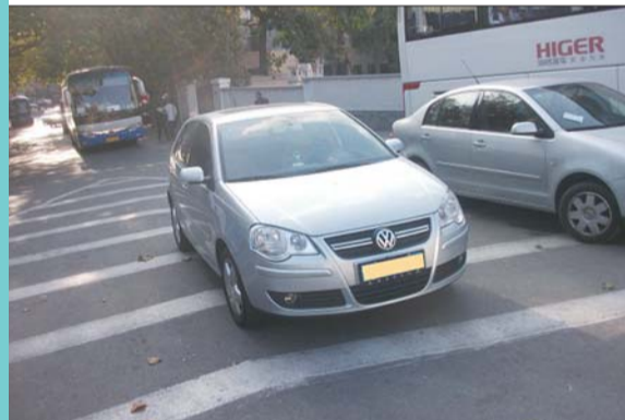
违法行为:遇前方机动车停车排队等候或者缓慢行驶时,在网状线区域内停车等候