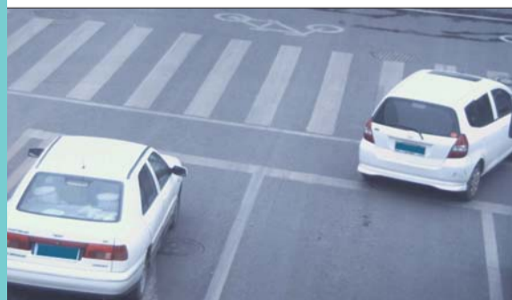
违法行为:直行车道右转