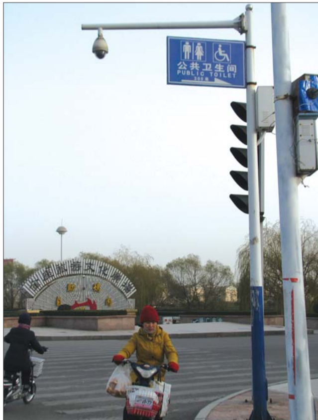
东岳大街与望岳西路交汇处公厕指示牌。

在东岳大街银座中心店前,记者看到,路灯上悬挂着“公共卫生间(泰安银座商城)”的蓝色指示牌,牌子下还公布监督投诉