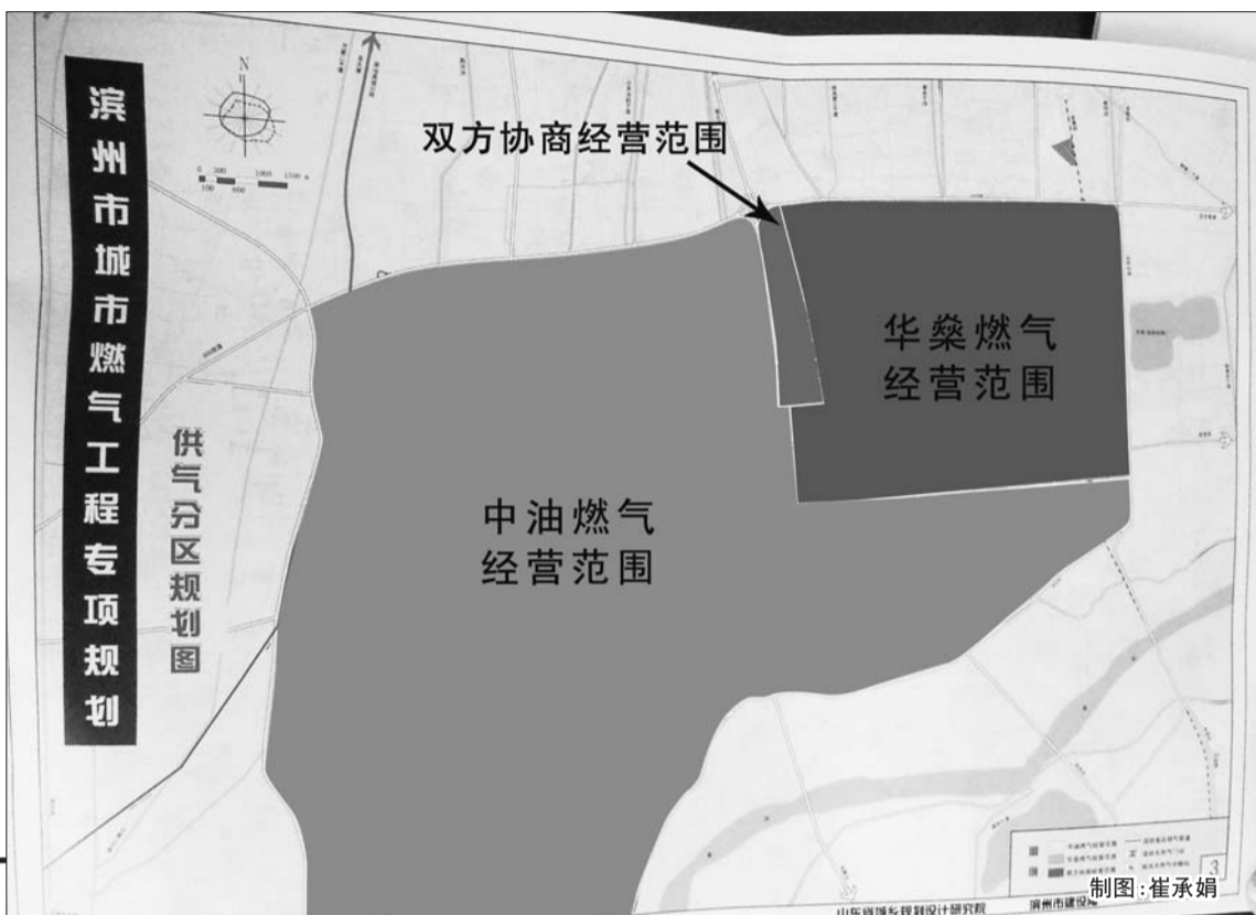
城区燃气经营范围图示。

近年,每到冬季,滨州天然气供应紧张就成了不少居民关注的问题之一。11月份以来,不少小区居民陆续向本报反映天然气压力不足的现象,并提出疑问“为何天然气压力不足多出现在华燊服务的小区”。有业内人士透露,在天然气本身就存在供应不足的大前提下,也与气源分配有关系,因为华燊的燃气供应掌握在中油燃气手中。