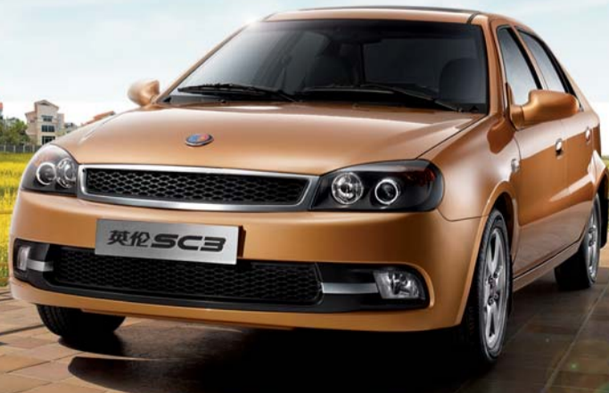
百年英伦 一脉相承