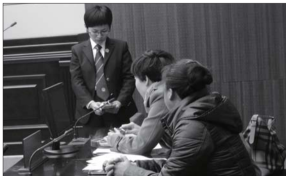
被告对原告提供的证物进行认证。

4日庭审时,七匹狼公司的代理律师首先提交多份证据,他们认为,被告商家作为专业的商业销售机构,具备相应的辨识能力,但却仍大肆销售上述侵权产品,没有尽到相应的义务,因此理应承担法律责任。被告认为,所售的商品并未用中文标注“七匹狼”,仅是一个近似狼的图形,作为一名下岗女工的她也无法辨识真伪“七匹狼”商标,加之超市经营面积较小,进货价格与销售价格较为接近,因此并不是以出售假冒商品作为主要经营。对于原告主张的高额赔偿,被告称不