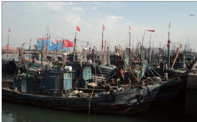
5日,积米崖中心渔港内停满了避风的船只。

5日,青岛海域海上风力达到10级,给岛城市民带来了寒意的同时,也影响了渔船和客运船只的出海。在积米崖中心渔港,当天150余艘渔船“窝”在港内,驶往灵山岛的客船和青岛轮渡也被迫停航。