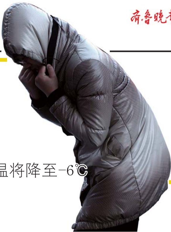
5日下午,在中山路上,行人被大风吹得弓着背行走。