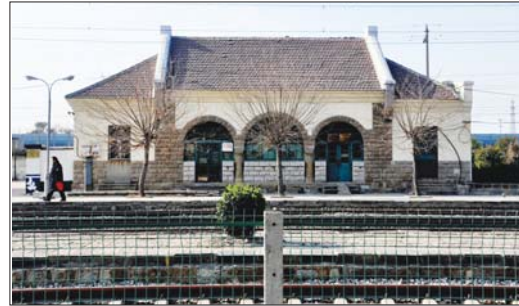
万德火车站老站房。

汽火车头从济南出发,一过白马山站就要开始冲坡,沙米店区间是千分之十一的大坡道,号称津浦线上的“屋脊”,货物列车都是双机车牵引,行车爬坡速度很慢,机车锅炉烧到最旺,耗煤耗水极大,列车爬到张夏站线路坡度放缓,机车头后挂水柜的水也消耗差不多了,必须在张夏站补充给水。张夏站的水塔,就是蒸汽机车时代生产方式的产物,承载着那个时期几代铁路机车工人