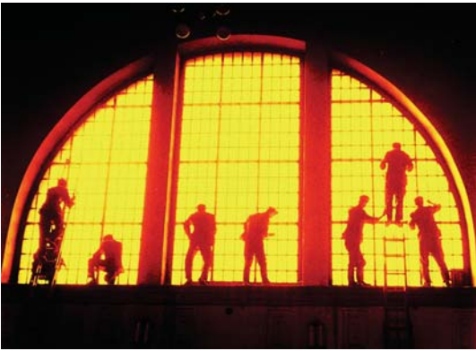
几名战士在擦老济南火车站售票厅圆窗。

最沉重的一张是1992年7月1日拍摄的,那天早晨一上班,工人们来到站房,一位工人在一站台人行天桥砸下了老车站拆除第一锤,这一锤也给许许多多济南人留下了不可抹去的伤痛。