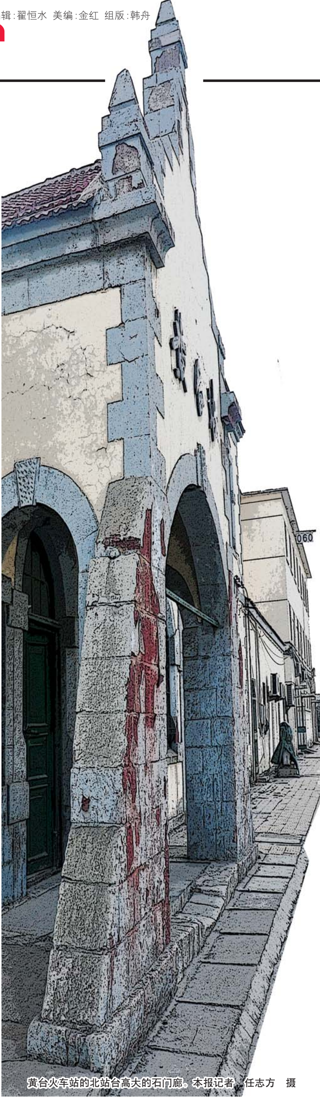
黄台火车站的北站台高大的石门廊。

该馆将加强境外关于济南城市记忆的历史资料的收集,力争建立起门类齐全载体多样的境外“济南记忆”资料库。捐赠活动结束后,西维亚一行返回山东建筑大学,来到位于该校图书馆的齐鲁建筑文化中心做客。在这里,西维亚夫妇表达了对山东建筑大学和姜波等人的感谢,“通过你们,济南给我们留下了那么深的美好印象,谢谢!”