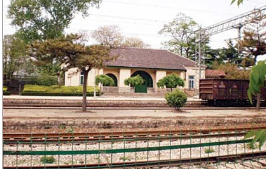
张夏火车站老站房。