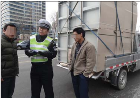
超高的货车被查。

据了解，6日是全省百日交通安全整治行动集中统一行动日，截至当天18时，全市交警部门共查处各类交通违法行为4600余起，其中超速1600余起，客车超员1起，超载120余起，疲劳驾驶10起，酒驾10起，涉牌涉证60余起，未按规定车道行驶400余起。