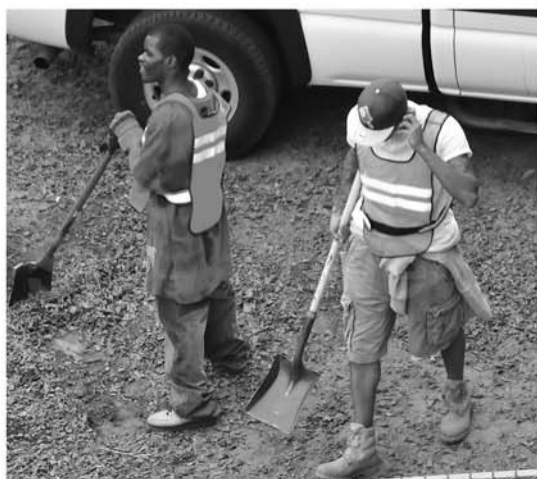
▲劳动之余布朗还有使用手机的权利。