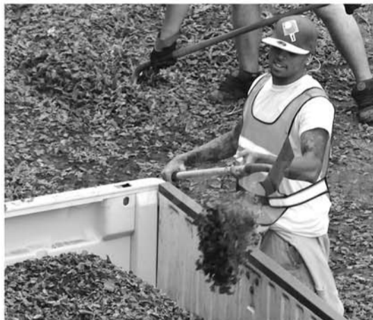
▲劳动的内容就是除掉地表的杂物。