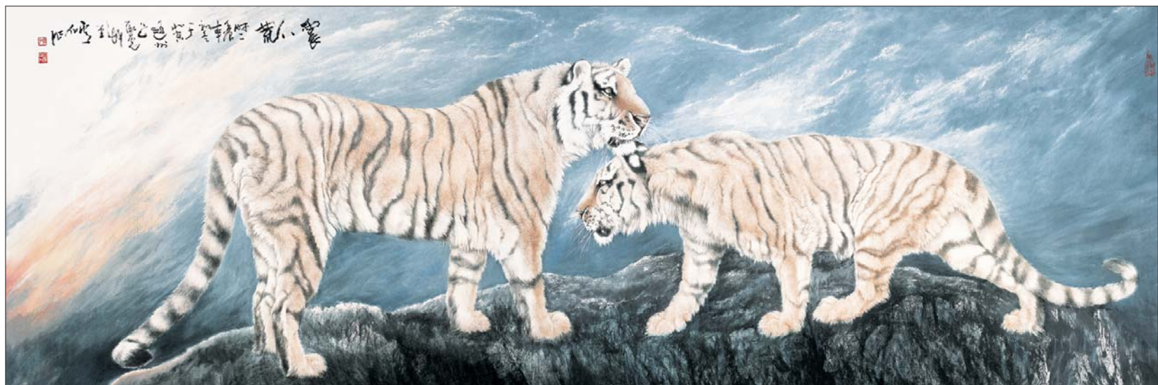
▲震八荒 163cm 488cm