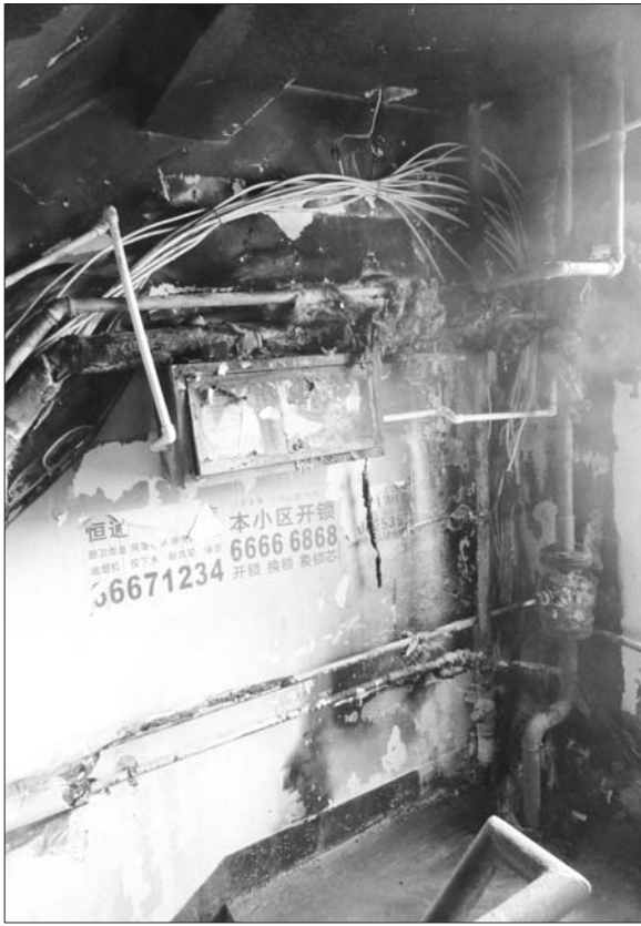
居民楼楼道内的水管、电线被烧毁。