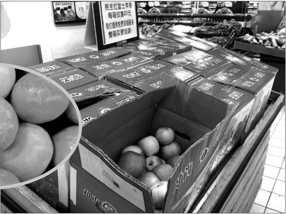
乐购超市原本出售“染色橙”的货架改卖苹果了。

名销售员告诉记者,超市内所售的脐橙,会保留供货商的供货记录,因此不可能有供货商敢冒险提供质量不合格的“染色橙”。她告诉记者,相比一些零散的水果批发市场,和一些市面上的水果摊,超市的水果相对而言,是比较安全的。