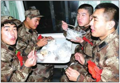
上了火车,再吃一顿家乡饭。