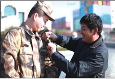
临行前,父亲为儿子整理戎装。