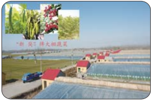
土地经营规模化——高效农业助农增收