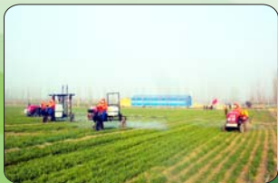
涉农服务专业化——植保合作社为农服务

今年以来,西岗镇紧紧围绕农村土地使用产权制度改革和新型城镇化改革试验两条主线,大力推进土地经营规模化、产业发展集约化、农民居住社区化、基础设施一体化、三农服务社会化“五化”建设,努力争当国家农村改革试验区建设的先行军,以农村综合改革的新成效推动经济社会的大发展。