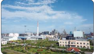
产业发展集约化——盛隆化工公司一角