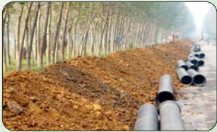
城镇管理精细化——煤气管道进社区