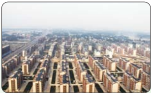
农民居住社区化——西岗镇中心社区香舍里花园航拍