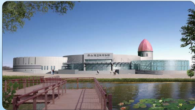
▲微山湖湿地博物馆