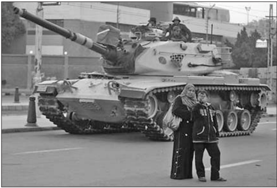
埃及男孩和他母亲在一辆军方坦克前拍照。12月10日,在开罗总统府前,一个路透