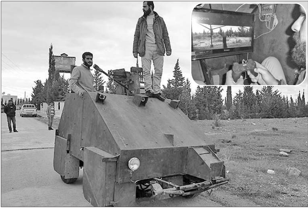
大图:叙反对派士兵自制的土坦克。 小图:机枪手通过“游戏柄”来操作机关枪。

报道称,这辆坦克是叙利亚阿勒颇地区一支反对派武装旅士兵花了一个月拼起来的,它由一辆汽车的底盘改装而来,身长4米,宽2米,坦克周身装有四个摄像头,驾驶员可通过摄像画面来观察周围敌情。坦克车装有1英寸厚的铁甲。该坦克被命名为“Sham II”,将很快加入阿勒颇地区的战争。