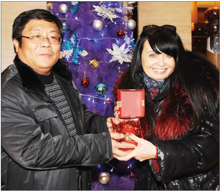
带上济南的一罐“故土”,西维亚十分激动。

“这是我在济南收到的非常非常珍贵的礼物,它是一种象征,意义非凡。”11日,西维亚从天桥区区委工作人员手中接过包装好的一罐土时激动万分,数次让人给她和丈夫拿着这罐土拍照。