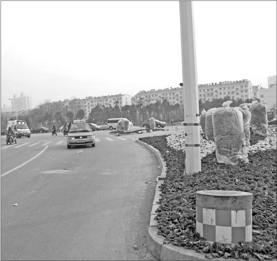
道路更加通畅,本报见习记者 王洪磊 摄

本报济宁12月11日讯(见习记者 王洪磊) 济安桥路与太白楼路路口东北角的道路完成渠化,新的导流岛已经建设完毕。此处较差的路况现在得到根本改善。 11日下午,记者来到济安桥路与太白楼路十字路口,路口的烂尾楼已经被不见了,东北角道路已经完成了升级改造,整洁而又平整,与原来坑坑洼洼形成了明显对比。东北角处也被建设了新的导流岛,导流岛上种植了新的羽衣甘蓝等