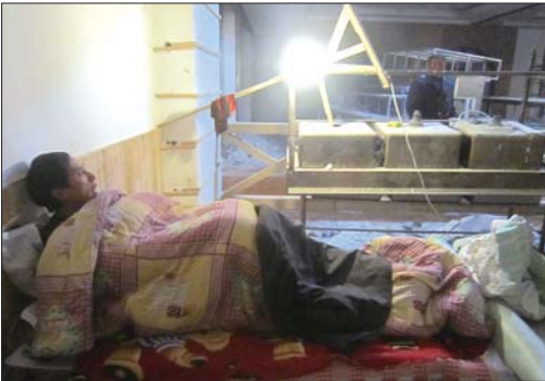
刘先生裹着被子和工地保安聊天。