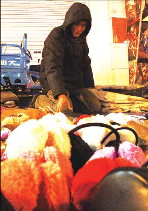
▶没有顾客的时候,杨先生跪在地上整理物品。