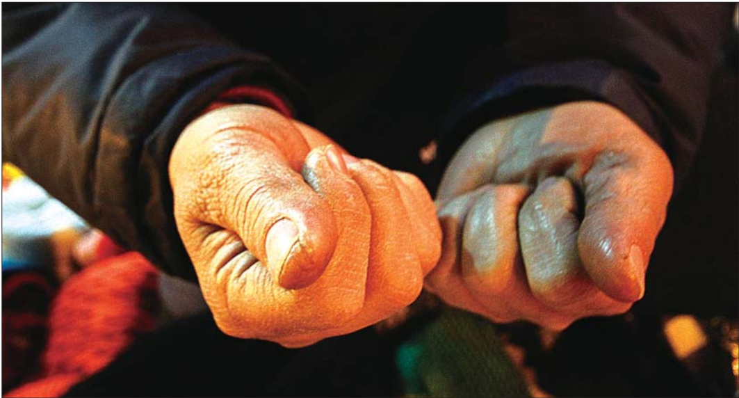
进入冬季,田女士的手已经被冻裂了几道口子。