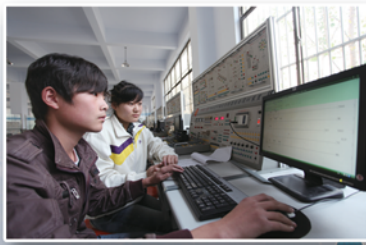
设计连接电路一体化