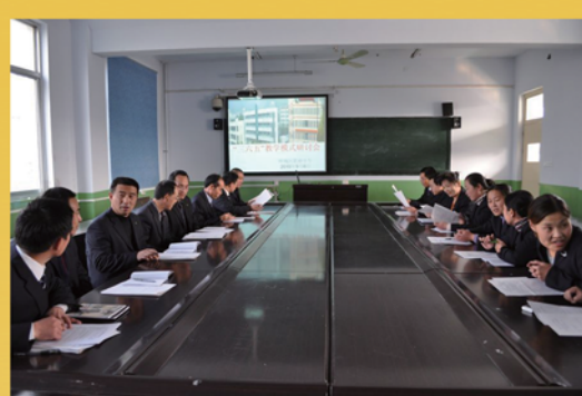
开展多种形式的教研活动