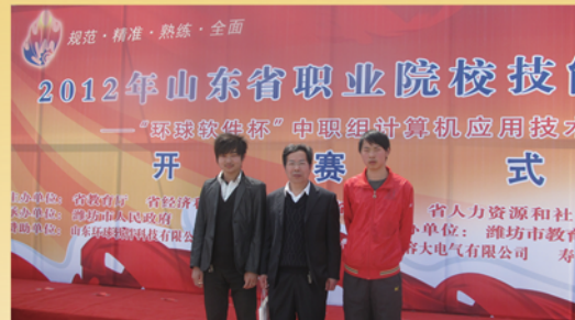
荣获全省技能大赛二等奖