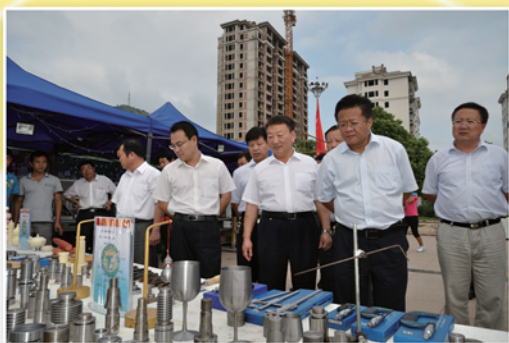
区领导观看学校展区

枣庄市峄城区职业中专位于冠世榴园的南麓,经济开发区内,是峄城区唯一一所公办国家级重点职业中专,现为劳动力转移培训阳光工程基地,职业技能鉴定基地。学校占地5.9万平方米,建筑面积3.8万平方米。校园分教学区、实习实训区、运动区、生活区,各区既相互独立又浑然一体。气势恢弘的教学楼、实训楼、科技楼、师生公寓、学生餐厅等矗立其间;5000平方米篮球场、300米环形塑胶跑道、乒乓球馆等大批体育设施整齐有序。在18年的发展历程中,始终秉承严谨治学、协作创新的校训,勤奋务实、开拓创新的校风,先后开设专业20余个,向社会输送高素质技能人才3万余人。近年来,在区委区政府的大力扶持和市区教育局的正确领导下,学校得到了持续性地快速发展。学校先后获得了山东省职业教育先进集体、山东省绿色学校、枣庄市职业教育先进单位、枣庄市技能大赛先进单位、枣庄市规范化学校、枣庄市花园式学校、枣庄市平安校园等。