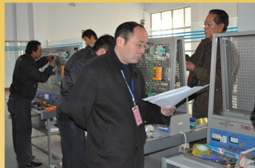
面向社会开展职业技能鉴定考试