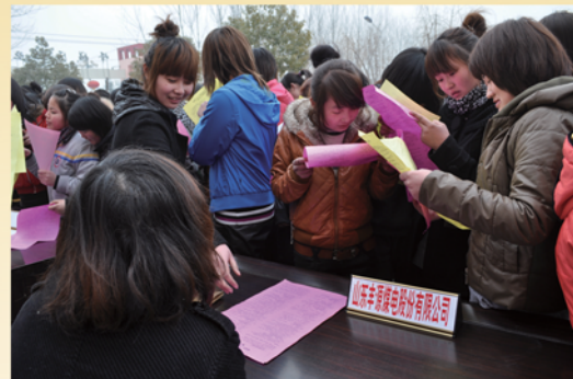
举行企业用工招聘会