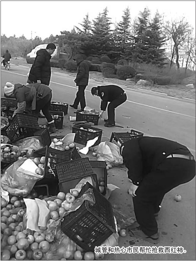
城管和热心市民帮忙抢救西红柿。

大概半个小时左右，散落的西红柿被检好装箱，“当时风很大，我看见他们的手都冻红了，但由于及时捡回，损失只在三千元左右，得到热心这么多热心人的帮助，真的很感谢”。