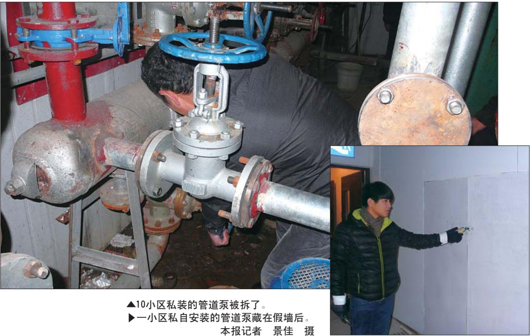
▲10小区私装的管道泵被拆了。 ►一小区私自安装的管道泵藏在假墙后。

本报菏泽12月13日讯(记者 景佳) 针对华英北路周边小区因偷暖造成的主管网紊乱情况,13日,菏泽市城市管理局联合供热公司开始严厉查处擅自安装管道加压泵行为,当日15时至21时,执法队将周边10个小区私装的管道泵拆除。 下雪了,没有暖起来的市民急盼热气来到。在12日菏泽市城市管理局组织召开的供热协调会上,菏泽市恒达热力公司负责人向城区116个小区的物业管理负责人和业主代表,指明了部分小区热不起来的原因,并指出了当前存在的最严重问题:小区擅自安装管道加压泵而造成华英北路附近主管网紊乱,期待这些小区予以配合,共同解难题,破僵局。 13日下午,菏泽市城市管理局,菏泽市恒达热力公司10余名工作人员组成专项执法队,开始查处小区擅自安装管道加压泵行为。 记者跟随执法人员在华英北路了解到,这里几乎每个居民小区都安装了管道泵。“正是这样才导致这里的供暖主管网紊乱,造成了都热不起来的局面。”执法人员介绍,最早安装管道泵的小区是5个换热站和二级管网建设不规范的小区,此后又有9个小区因受5小区影响热不起来而私自安装管道泵争暖。 13日15时至21时,执法人员先后关停拆除了水岸嘉苑、怡景蓝湾、房管局家属院、规划局家属院、荷清园、帝都花园、天润康城、南华康城、畅志园、盛世豪庭等10个小区私自安装的管道泵。值得一提的是,这些小区物业及业主都非常配合。此外,因时间关系,还有一些小区私装的管道泵未被拆除,热力公司技术人员连夜在周边路段值班巡逻,一经发现他们使用管道泵,将连夜予以查处。 记者现场看到,这些私装管道泵大都安装在小区换热站内,但也有小区为了不让热力公司发现而“藏猫猫”:有的安装在换热站墙体背面,还有有的在管道泵外搭建了一层外墙。但热力公司早已在主管网上安装了无线远传检测仪器,“我们通过无线远传监测主管网入小区后流量的变化,能清楚地查出该小区是否使用了管道泵。” “按照山东省供热管理办法有关规定,任何用热单位和个人,均不得在供热管道上安装管道泵等改变供热运行方式。违者,由供热主管部门限期整改,逾期未整改的,对单位可处以5000元以下的罚款,造成损失的,依法承担赔偿责任。”菏泽市城市管理局工作人员介绍,执法人员将该路段管道泵全部拆除后,主管网运行将恢复正常,这些路段供暖管线材料、设计无问题的小区居民家中将都暖起来。