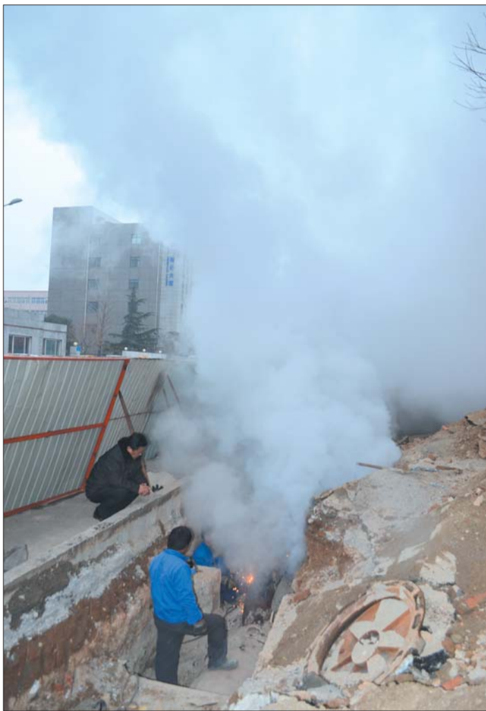
位于华龙路与华阳路交叉口的一段供暖管道出现漏点,蒸汽滚滚冒出。16日,抢修人员正在进行检修。

本报12月16日讯(记者 王光照 王光营)15日下午,华龙路供热蒸汽主管网爆裂。为使居民供暖短时间内不受影响,该管网爆裂后一直“带病”运行。16日下午,供热部门确定了最终抢修方案:16日晚停暖抢修,华龙路两侧蒸汽自管站小区供暖将受影响,范围约几十万平方米。抢修至少需要六七个小时,力争17日清晨恢复供暖。