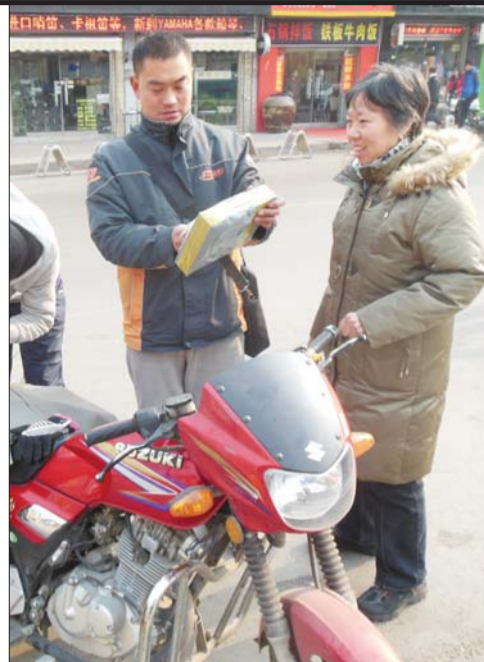
快件送到。