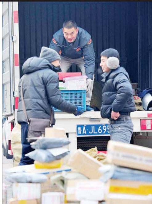
分到快件,忙碌的一天开始了。