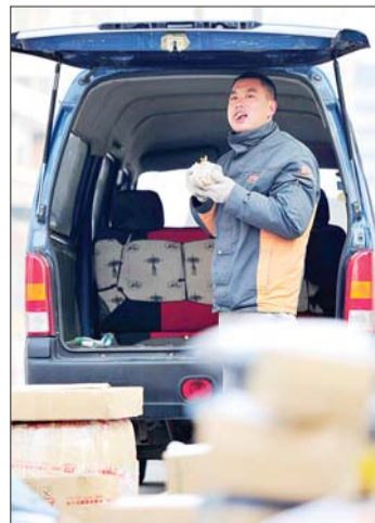
在面包车边,匆匆吃顿饭。