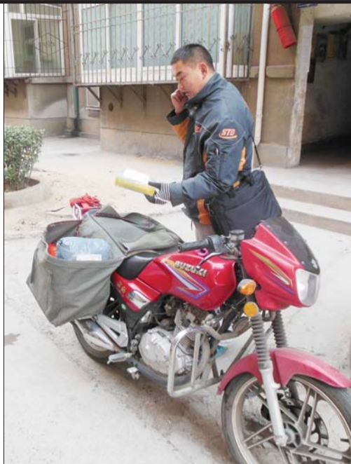
每天都接打一两百个电话。