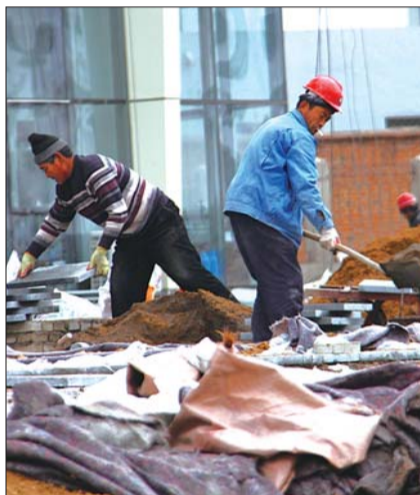
12月20日,市区一建筑工地上,工人们正在紧张施工。