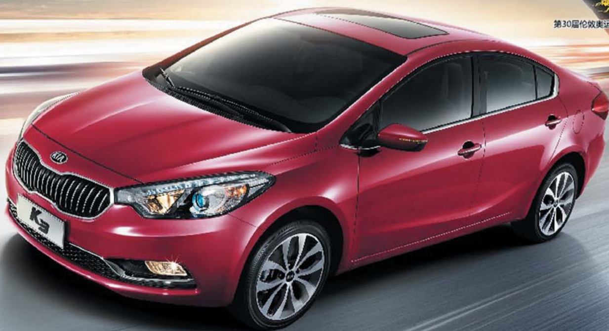
第30届伦敦奥运会乒乓球冠军 张继科