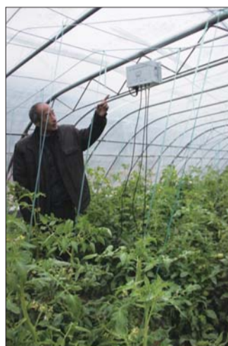
大棚内,蔬菜物联网的传感器。

实现物联网监测蔬菜的温湿度及土壤墒情只是初步阶段,下一步,滨州经济开发区将要在着力打造的万亩玫瑰基地以及海棠基地也建立同样的物联网监测系统,还要实现物联网系统的升级,安装农产品安全质量追溯系统,让消费者