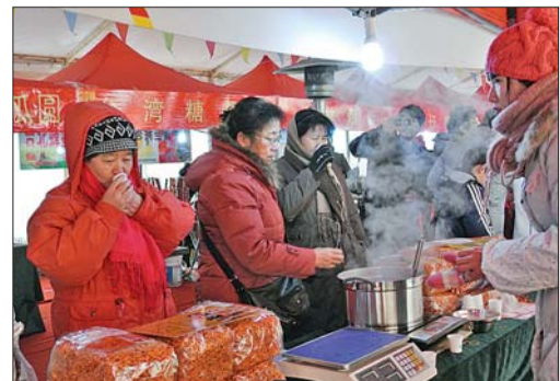
青岛市民来到云霄路台湾年货大集品尝台湾食品。

本报青岛12月23日讯(记者 李晓闻 张晓鹏) 23日,不少青岛市民来到云霄路的台湾年货大集。这是青岛市南区冬日时尚消费节的一个重要板块,将持续至2013年1月5日。活动期间近百名台商将向市民展示80多种最具年味的台湾特色商品。