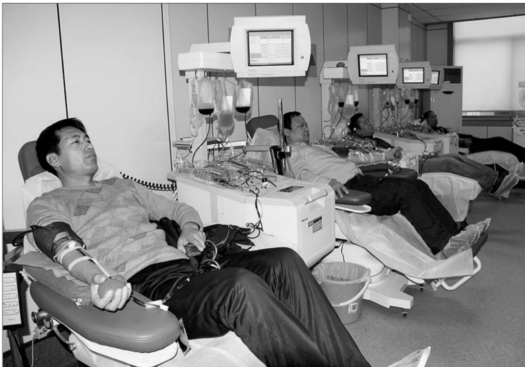
▲21日,热心市民正在捐献机采血小板。

而在临淄泰客隆超市附近的采血车上,一名正在献血的李女士告诉记者:“献血是为了帮助别人,而下雪时献血给自己的印象更加深刻”。