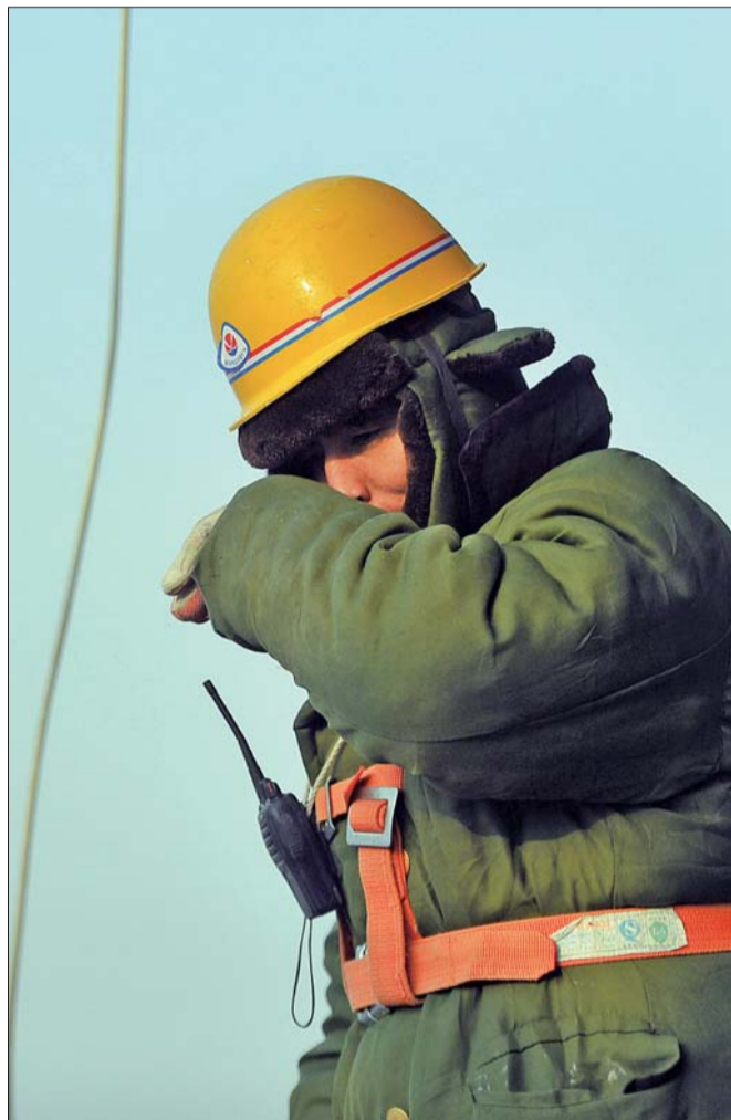
24日,济南一在建高层建筑的23层上,一位建筑工人在寒风中不停地搓搓冻得流鼻涕的鼻子。